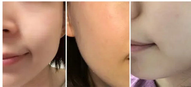
※メイクアップ効果